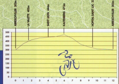
Circuit des ROCHES